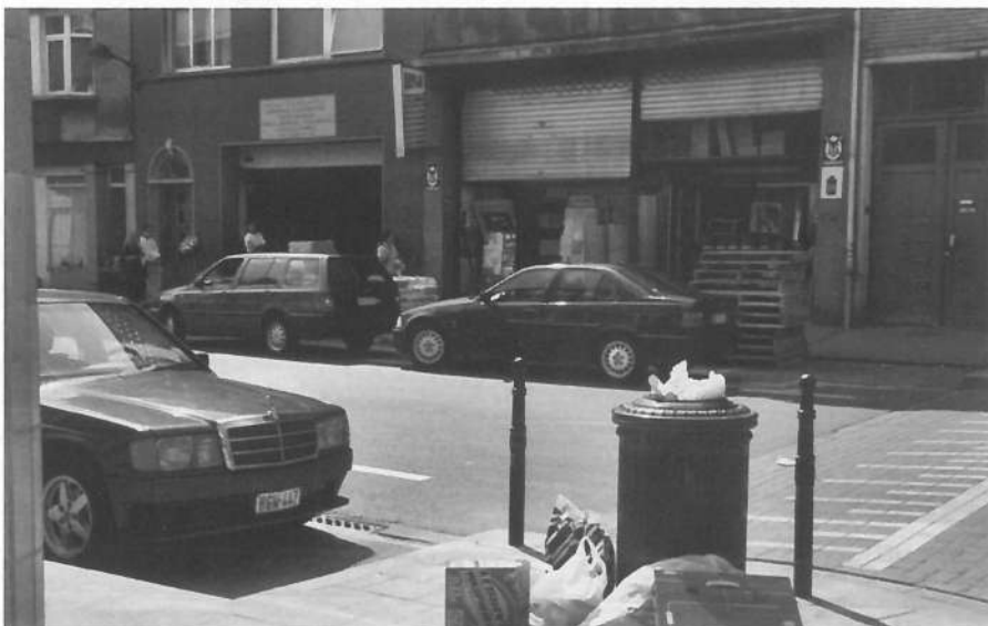
De Antwerpsesteenweg in de Oude Noordw. De vroegere detailhandel is voor een groot deel vervangen door garages en opslagplaatsen.

Nieuwe migraties kwamen in de interviews ook indirect aan bod, namelijk wanneer gevraagd werd naar het buurleven, de samenlevingsproblemen en contacten tussen de verschillende etnische groepen. Beide buurten hebben een overwegend Marokkaans karakter. Zij voelen zich, samen met de Turken de gevestigde bewoners, zeg maar de autochtonen. De weinige Belgen die er nog wonen zijn bijna rariteiten. De houding van deze gevestigde groepen tegenover de nieuwkomers uit Oost-Europa is in beide buurten tweezijdig. Enerzijds stelt iedereen geen contact met hen te hebben, de taalbarrière is onoverkomelijk. De Oost-Europeanen verblijven ook maar tijdelijk in de buurten en leven binnen hun eigen groep. Volgens sommigen komen ze bovendien om zwart te werken ten dienste van de gevestigde groepen en bezorgt ze niemand last. Volgens anderen ec-