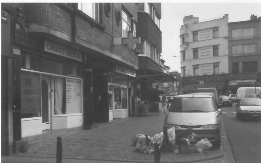
De Ribaucourtstraat in Laag-Molenbeek.

Arbeid, in het officiële circuit of niet, beschouwen vele geïnterviewden als positief, terwijl niet werken bedreigend overkomt. Dit privilegiëren van werkende mensen is ingegeven vanuit de bezorgdheid om het voortbestaan van de welvaartsstaat. Takahashi & Dear benoemen deze houding als het stigma van de non-productiviteit. Het stigma van de non-productiviteit was in Europa altijd minder uitgesproken dan in de Verenigde Staten, omdat Europese welvaartsstaten voordelen toekennen aan veel bredere lagen van de bevolking. Maar sinds de crisis van 1973 heerst ook in Europa een concurrentie om de schaarser wordende middelen en wordt ook hier de idee van persoonlijke ver-