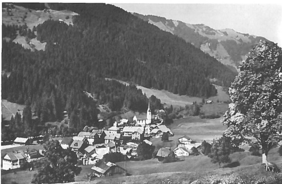
Landschappelijke en klimatologische kwaliteiten van het woonmilieu liggen mede ten grondslag aan de economische groei van de High Lands in het Alpengebied.

In de jaren zeventig was het kerngebied van Europa in het noord-westen van het continent gesitueerd. Dit Westeuropese kerngebied is aan veranderingen onderhevig. Het laat zich aanzien dat het gebied 'uiteengetrokken' wordt in twee afzonderlijke kerngebieden, van verschillende signatuur. We noemen ze respectievelijk de 'High Lands' en de 'Low Lands'. De algemene opvatting is dat binnen Europa een verschuiving van economische activiteiten naar het zuiden plaatsvindt.