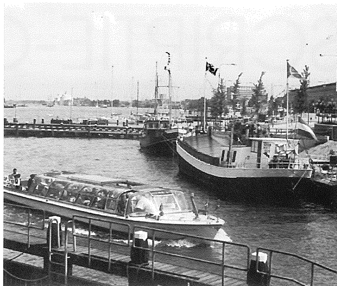
IJ-oeveren: huizen in plaats van kantoren.

Te bestellen bij NGS, Postbus 80123, 3508 TC Utrecht; ISBN 90-6809-168-9, prijs f 35,- (incl. porto).