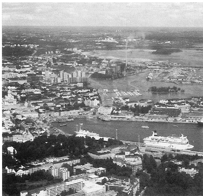
80e IFHP-congres in Helsinki.

De theorieën over de ontwikkeling van de stedelijke structuur en de ontwikkelingen op de woningmarkt lopen achter de werkelijkheid aan. Dat is de conclusie van de studie Stad en woningmarkt in een veranderende samenleving ;