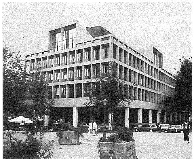
Maupoleum wordt ingrijpend verbouwd.

Van 26 september tot en met 2 oktober wordt in Helsinki het tachtigste World Congress van de International Federation for Housing and Planning (IFHP) gehouden. Met de steeds verder gaande urbanisering wordt het steeds moeilijker doel, vorm en beheer van de toekomstige stad te bepalen. Op het congres, dat als thema 'Cities for tomorrow, directions for change' heeft, geeft een aantal sprekers waaronder Manuel Castells en David Harvey een visie over de mogelijkheden de stad een solide basis voor de toekomst te geven. Daarnaast wordt een breed scala aan workshops en