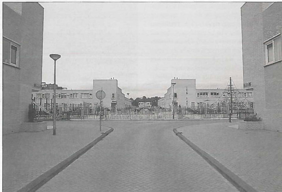
Praktijkruimten op de hoeken van woonstraten dragen bij aan de functiemenging.