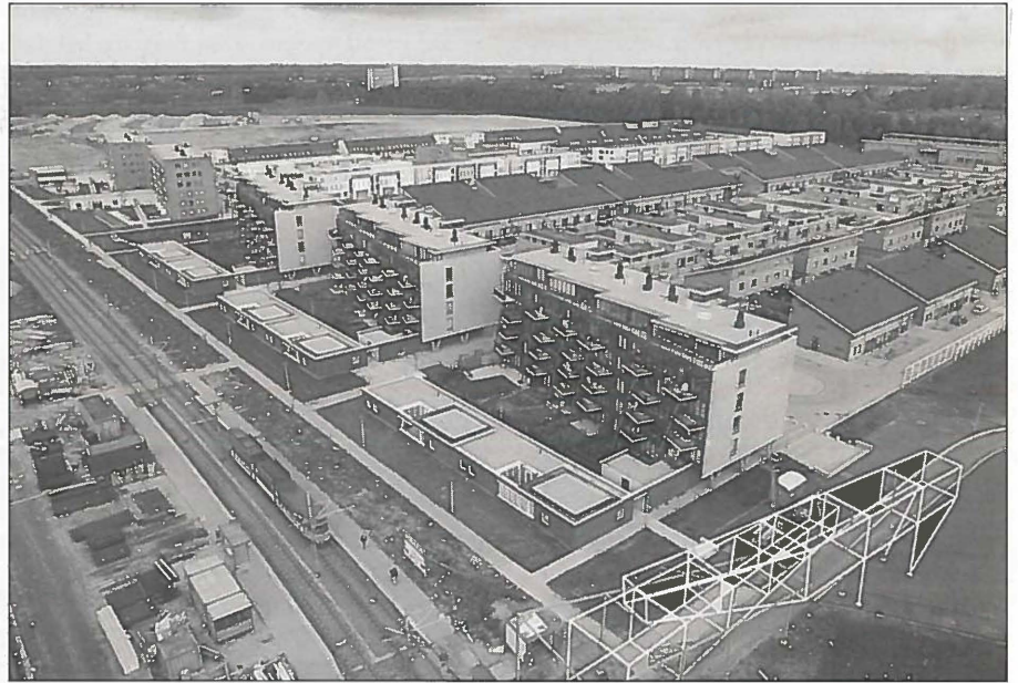
Het centrum van Nieuw-Sloten wordt gemarkeerd door hogere bebouwing.

De oplossingen hiervoor waren een rijkere menging van het programma en het inschakelen van een onafhankelijk persoon die tijdens het ontwerpproces het gebied tussen de gevels bewaakt en de belangen afweegt. Bij de inrichting van het openbaar gebied zijn veel instanties gemoeid, die gebonden zijn aan ei-