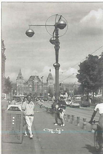
Nieuw straatmeubilair op het Damrak in Amsterdam.