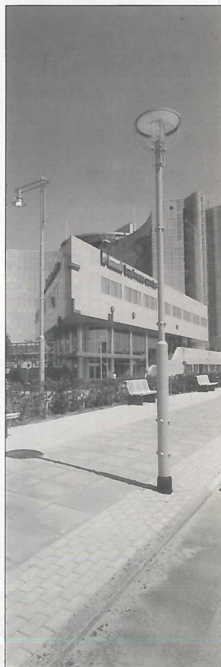
Functionele objecten op ordelijke en samenhangende wijze in openbare ruimten toegepast: Amsterdam Teleport. Bron: dRO Amsterdam

* De auteur is werkzaam als coördinator Straatmeubilair bij de dienst Ruimtelijke Ordening (dRO) van de gemeente Amsterdam.