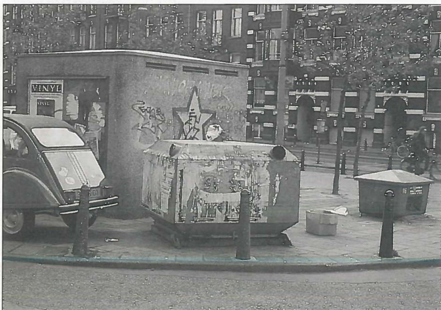
De glas- en papierbakken bevinden zich ‘nog steeds in het stadium van prototype’.

De overeenkomst van de inrichting van de openbare ruimte met de ontwikkelingen in de kantoorautomatisering en de inrichting van kantoorruimten is opmerkelijk: zonder het nog