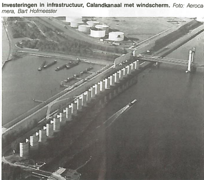
Investeringen in infrastructuur, Calandkanaal met windscherm.

Stichting Nederland Nu Als Ontwerp. Postadres/ Secretariaat: Prinsengracht 483, 1016 HP Amsterdam. Bezoekadres: Beurs van Berlage, kamer 38, Damrak 62a, 1012 LM Amsterdam. 020-271710 en 020-271755.