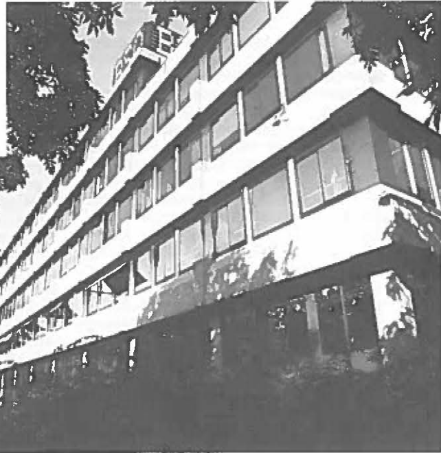
De meeste kwartaire dienstverlening, representatief voor het informatietijdperk, bevindt zich in de Randstad. Grote steden en sub-urbane milieus scoren hoog bij deze vorm van bedrijvigheid.