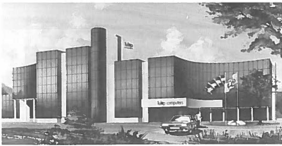
Kansrijke bedrijvigheid in Zuidoost-Nederland: Het nieuwe hoofdkantoor van Tulip Computers in 's-Hertogenbosch.