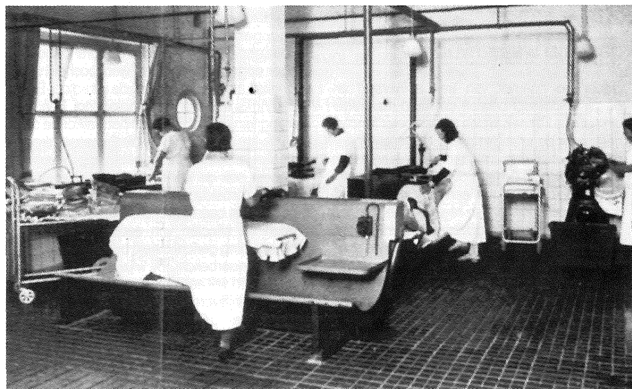
Collectieve voorzieningen spelen in utopische ontwerpen altijd een belangrijke rol.

barmelijke leefomstandigheden in de grote steden tijdens de begintijd van de Industriële Revolutie. Zo ontstaat ook de tuinstadgedachte, waarmee onverbrekkelijk de naam van Ebenezer Howard is verbonden. Zijn 'Garden City Movement' is van grote betekenis geweest voor de tuindorpen, die in het begin van deze eeuw ook in Nederland op veel plaatsen zijn gebouwd. Hoe goed bedoeld ook, in de jaren '20 heeft het tuindorp-idee bij veel progressieve stedenbouwers al weer afgedaan. Zij laten zich inspireren door socialistische ideeën van geheel andere aard en verwerpen de tuinstadgedachte als burgerlijk en individualistisch. De nieuwe mens, onvermijdelijk produkt van de maatschappelijke ontwikkeling, zal in hun ogen een collectieve mens zijn, met corresponderende woonbehoeften. In 1928 richten enkele belangrijke architecten, waaronder Le Corbusier en Van Eesteren, de CIAM op: 'le Congrès International de l'Architecture Moderne'. Voor de 'moderne bouwers' is duidelijk dat een radicale breuk met het verleden nodig is. De nieuwe