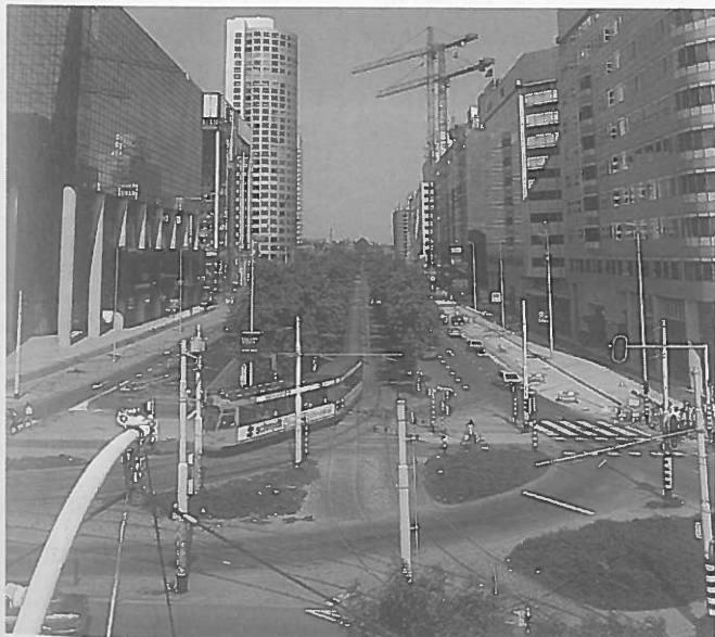
Onmisbaar kader ...

Als sombere lange-termijnvoorspellingen van het Centraal Planbureau uit 1992 bewaarheid worden, zal het eigen vermogen van een gemiddelde woningcorporatie in 2005 met liefst 80% zijn afgenomen. Een optimistischer scenario leidt in dezelfde periode tot een forse stijging van het eigen vermogen. Dit zijn de uitkomsten van een nieuw rekenmodel dat is ontwikkeld door de SEO,