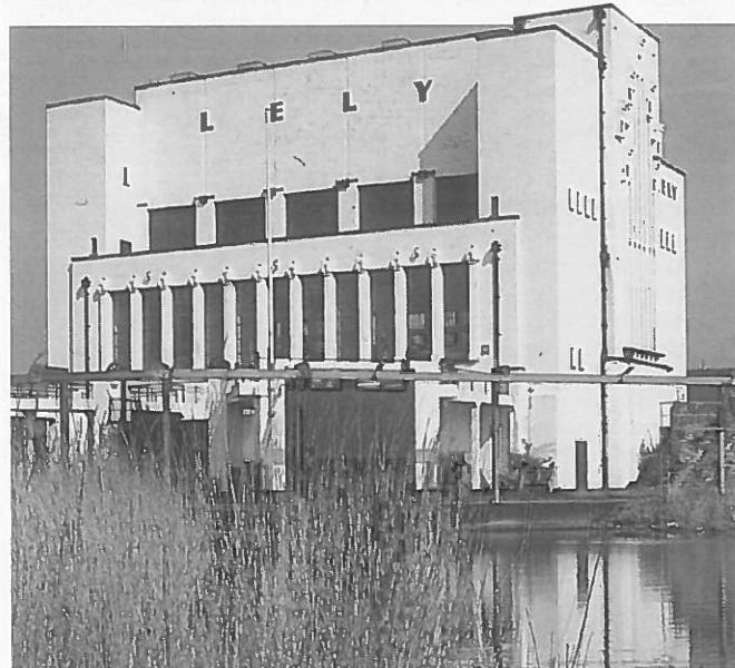
Stenen getuige: gemaal Lely aan de Afsluitdijk

Informatie bij het Secretariaat Voorbeeldplannen van de RPD, Postbus 30940, 2500 GX Den Haag, tel. 070-3391077