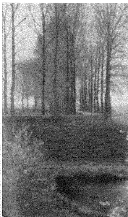
Zeedijk nabij het Wiel.

In 1992 werd de Dordtse Structuurvisie uitgegeven. Dit plan vormt een raamwerk voor de gewenste ruimtelijke ontwikkelingen binnen Dordrecht op langere termijn. Opvallend aan de structuurvisie is de nadruk op de ruimtelijke inpassing van ontwikkelingen vanuit kwalitatief oogpunt. Dat geldt ook voor het gebied dat in de structuurvisie wordt aangewezen als laatste stedelijke uitbreiding van Dordrecht in zuidoostelijke richting, de Buitenstad .