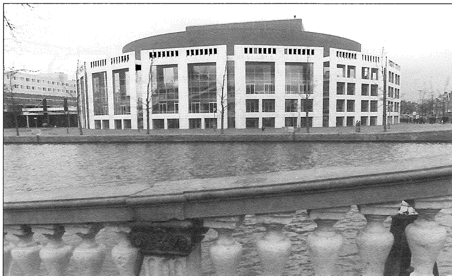
In Amsterdam worden de messen geslepen voor een partijtje landjepik.

Sinds 1989 wordt de grote steden en hun randgemeenten, rond welke de problemen