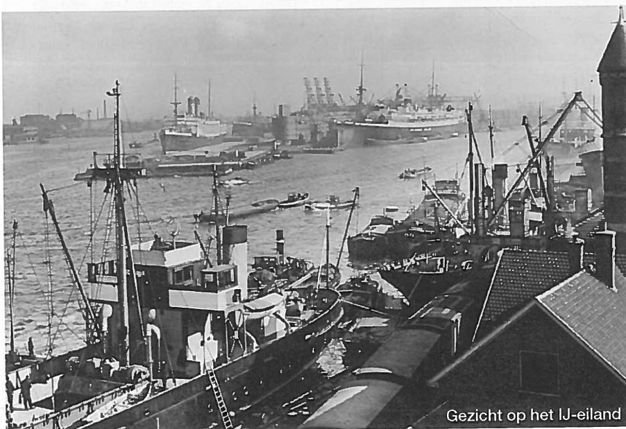
Annexatie voor havenexpansie in de 19e eeuw. Panorama vanaf het Centraal Station in Amsterdam

Aan het andere uiterste van de oplossingschaal staat het middel van de fiscale centralisering . Het lokale belastinggebied wordt afgeschaft en alle belastingen worden rijksbelastingen. De gemeenten krijgen vervolgens uitkeringen van het Rijk volgens vastgestelde criteria waarbij expliciet wordt rekening gehouden met centrumfuncties. Deze oplossing, die gemeenten meer onafhankelijk maakt van de samenstelling en omvang