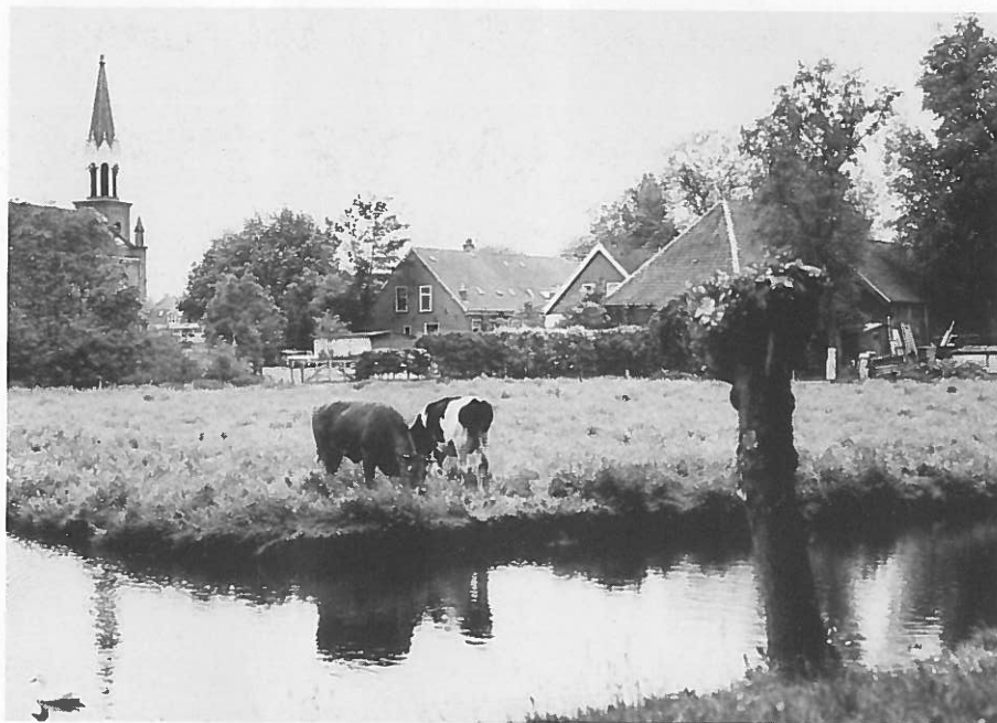
Annexatie van kleine gemeenten: Sloten in Amsterdam