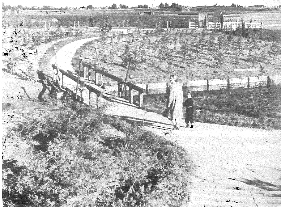
Het ophaalbruggetje in de buurt van de grote speelweide in 1934 ...

Het Bos heeft 4 miljoen bezoekers per jaar, vergeleken met de recreatiegebieden Twiske (730.000) en Spaarnwoude (1,2 miljoen) een beduidend hoog aantal. Ook uit de Omnibusenquête '86 bleek dat het Amsterdamse Bos het best bezochte recreatiegebied in of in de buurt van Amsterdam is.