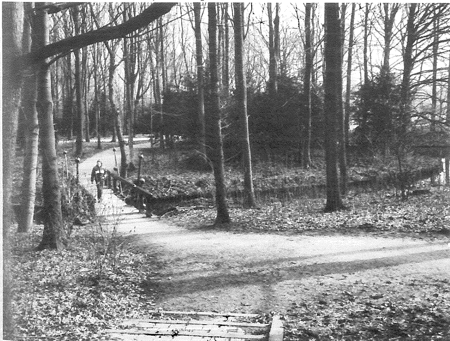
... en in 1989.

Daarbij moet volgens mij worden gedacht aan het toegankelijk maken van de noordelijke oevers van het Nieuwe Meer ten behoeve van waterrecreatie, zoals zwemmen en surfen, de aanleg van een zwemgelegenheden elders in het Bos, exploitatie van theater-, kunst- en muziekactiviteiten en een groter en gedifferentieerder aanbod van horecavoorzieningen.