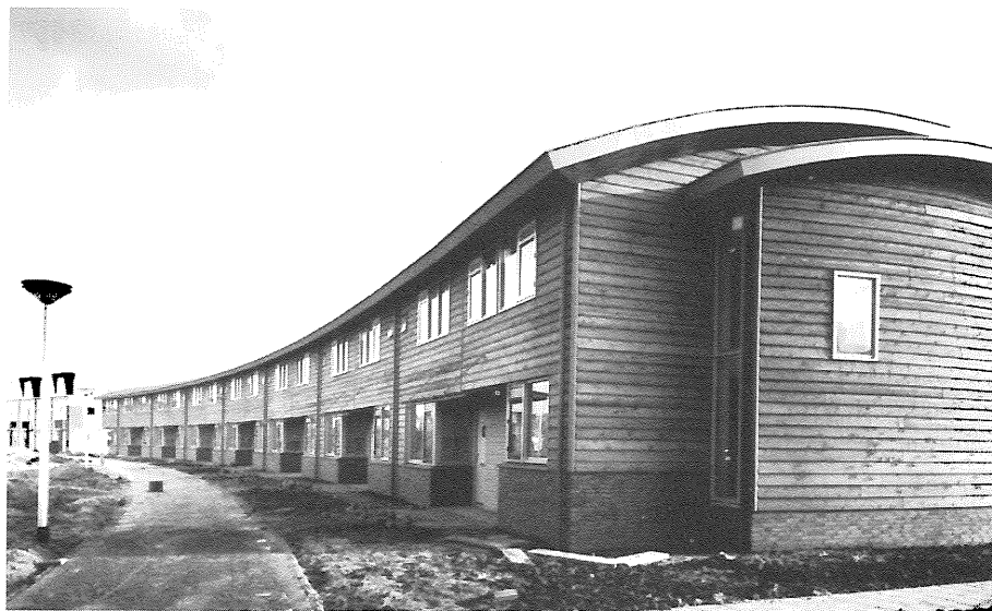
Houtskeletwoningen van architect Lafour en Wijk op de Buitenexpositie van de BouwRAI in Almere.