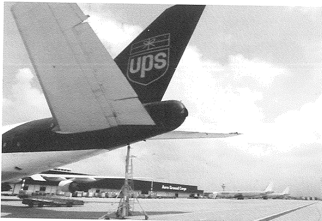
Nederland Distributieland: kwaliteit en service uitspelen om gateway-functie te behouden.

In het verlengde van het Amerikaanse GIS World verschijnt sinds kort het Engelstalige GIS Europe , het eerste specifiek op ons werelddeel gerichte GIS-tijdschrift. In het bijna honderd pagina's tellende blad wordt ingegaan op internationale ontwikkelingen op het gebied van GIS-technologie, toepassingen, nieuws en informatie, die wordt verzameld door redactionele bureaus in Nederland en het Verenigd Koninkrijk en door redactionele medewerkers in de meeste grote Europese landen. GIS Europe verschijnt tien maal per jaar in full color. Om het blad voor zoveel mogelijk lezers toegankelijk te maken is de abonnementsprijs laag gehouden: f110,- per jaar of f178,- per twee jaar. Informatie bij de uitgever: GIS Europe, Postbus 197, 8530 AC Lemmer, tel. 05146-1281.