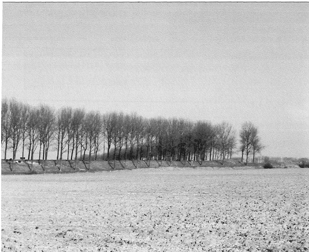
Het karakteristieke landschap van Tholen zal binnenkort worden verstoord door enorme varkensstallen.