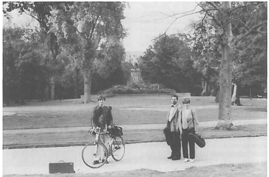
Het Vondelpark.

De belangrijkste resultaten van het onderzoek in het Vondelpark, waarvoor