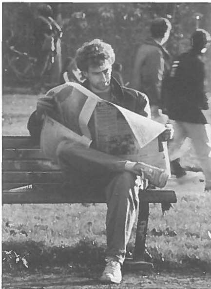
Kortstondig alledaags gebruik van het Vondelpark.

Concreet voor het Vondelpark zou moeite gedaan moeten worden het park als openbare ontmoetingsruimte voor alle Amsterdammers te koesteren. De diversiteit in het gebruik en de functie van stedelijke ontmoetingsplaats moeten niet uit het oog worden verloren. Het park heeft een stedelijke betekenis en hoort eigenlijk onder het bestuur van de centrale stad te vallen.