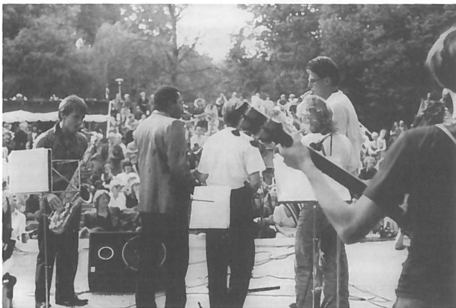
Optredens in het openluchttheater van het Vondelpark trekken veel bezoekers.

De individualiseringstrend krijgt in het Vondelpark al duidelijk gestalte. In de stad Amsterdam zal die trend zich in de toekomst nog nadrukkelijker manifesteren. Dat vereist uiteraard een andere aanpak van de openbare ruimte dan enkel 'aankleding', waarover het Ministerie van Landbouw spreekt. Voor het Amsterdamse recreatiebeleid zijn de implicaties van verschuivingen in relatievormen voor het alledaagse openbare leven belangrijk: alleenstaanden zijn immers eerder geneigd openbare ruimten op te zoeken.