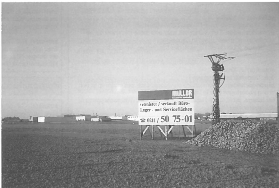
Het grote bedrijventerrein Aachener Kreuz ligt direct aan de snelweg.

Gerd Klinkers is in juni 1990 aan de Katholieke Universiteit Nijmegen afgestudeerd als planoloog en is werkzaam bij CROONEN ADVISEURS B.V. in 's-Hertogenbosch. Dit artikel is gebaseerd op zijn afstudeerscriptie Bedrijventerreinen en Europa 1992 . Deze scriptie is deels tot stand gekomen tijdens een stageperiode bij de Kamer van Koophandel en Fabrieken voor de Mijnstreek in Heerlen.