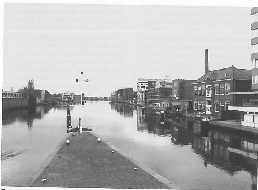
Bouwen op stedelijke locaties: de Zaanoevers.

Om de meningen van de inwoners over de toekomst van hun gemeente te peilen, liet Zaanstad een enquête uitvoeren waarin ook de drie scenario's werden voorgelegd. Op het onderzoek valt nogal wat af te dingen. Ten eerste is uit tijdgebrek gekozen voor een telefonische benadering van de respondenten, een methode die meer geschikt is voor peilingen van het voorkeursmerk broodrooster dan voor de toekomst van een stad. In de enquête is nauwelijks aandacht geschonken aan de consequenties van de keuze voor een scenario. In een gemeentelijke brochure wordt erop gewezen dat iedere optie zowel iets 'zuurs' als iets 'zoets'