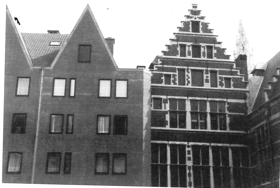
Stadsvernieuwing in Antwerpen: "Het probleem is dat (...) slechts eenzesde van het benodigde budget beschikbaar is."

LIA DE LANGE EN PETER GRAMBERG Redactie AGORA