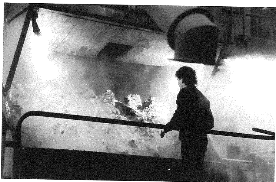
De Waalse economie wordt gedomineerd door sectoren van zwakke groei.

De onderlinge concurrentie tussen Charleroi en Luik, alsook de excentrische positie van laatstgenoemde ten opzichte van het Waalse territorium, verklaren de keuze van Namen als administratieve hoofdstad van het nieuwe Waalse Gewest. Namen is voordelig gesitueerd op de kruising van de twee belangrijkste Waalse verkeersassen: de as van Sambre en Meuse en de as die Brussel met Luxemburg verbindt. Maar deze keuze versterkt nog eens de potentiële gevaren voor een verdere verbrokkeling van de reeds zwakke Waalse urbane structuur. Tegelijkertijd worden de banden tussen Wallonië en Brussel, de enige stedelijke pool van internationaal niveau, zwakker.