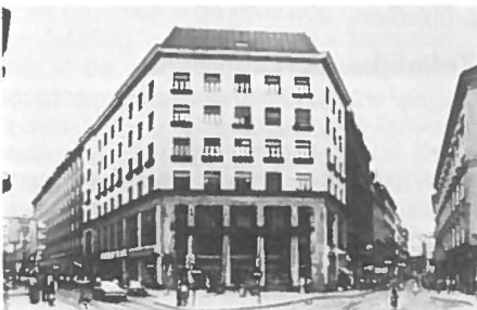
De contradictie in het werk van Loos: een begane grond rijk aan marmeren platen en pilaren met daarboven volstrekt kale gevels.