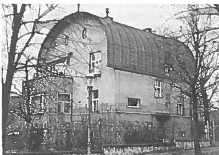
Een ander ontwerp van Loos, 1913.

tuur. Waar Wagner de maatschappij nog bewust inzichtelijk maakte, volgen de huidige architecten de techniek blindelings. Veel moderne gebouwen zijn metaforen van een ongeremd technologisch vooruitgangsgeloof en een ongebreidelde consumptiedrang. De betreffende architecten voorzien niet dat de huidige techniek vooral repressief werkt. Juist met behulp van de moderne technologie maken Westerse staten en multinationals de ongelijke machts- en bezitsverhoudingen in de wereld steeds ongelijker. In de Wagner-variant is voor een dergelijke vooruitgangskritiek geen plaats.