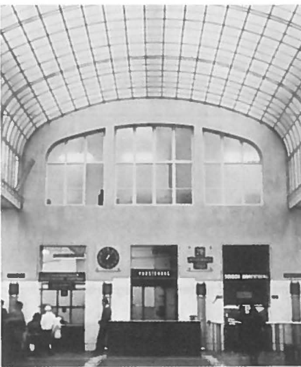
Wagner stelde de zakelijke werkelijkheid centraal. Dit komt bijvoorbeeld tot uitdrukking in de door hem in 1903 gebouwde Postsparkasse in Wenen.