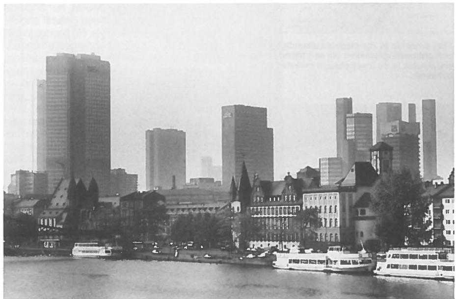
Frankfurt am Main heeft op een 'Sittesque' wijze getracht de sfeer in de stad terug te brengen.

Aan de hand van drie Weense architecten van rond de eeuwwisseling, Camillo Sitte,