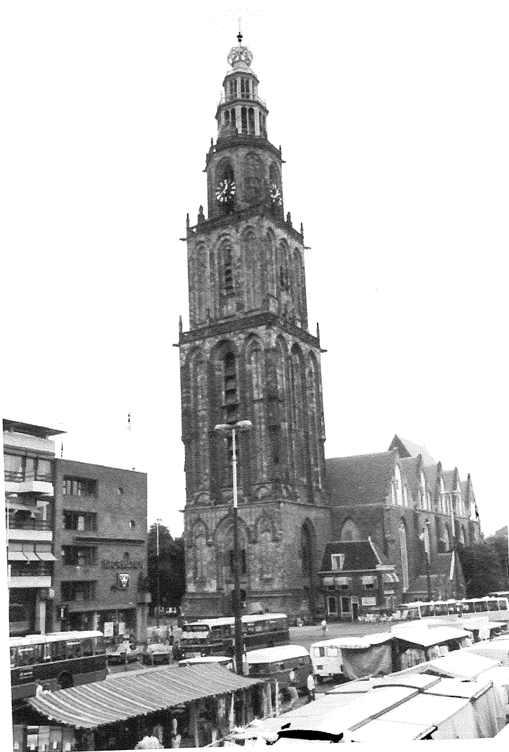
De Grote Markt met de Martinitoren: toekomstige 'huiskamer' van de stad Groningen?

Een bedreiging voor het dagelijks leven in de stad zelf is volgens Groen Links het