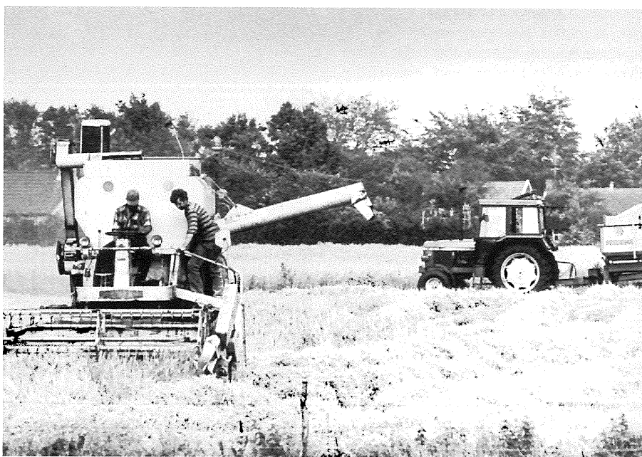
Graanteelt was binnen de landbouw de belangrijkste bedrijfstak in het Oldambt.

Tevens wordt voorgesteld een deel van de intensieve veeteelt, inclusief de varkensfokkerijen, naar het noorden over te plaatsen. De mestoverschotten worden