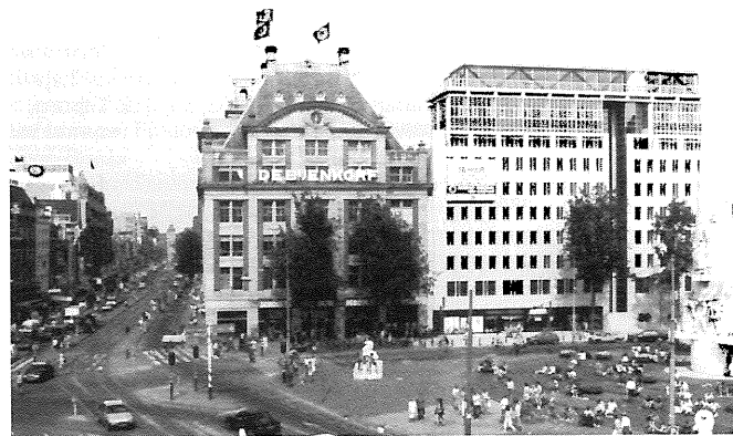
Het nieuwe kantoorgebouw naast de Bijenkorf op de Dam in Amsterdam: "positief gewaardeerd met een teleurstellende afloop".

Informatie bij de Bouw- en Woningdienst Amsterdam, tel. 020-5969111/5964390