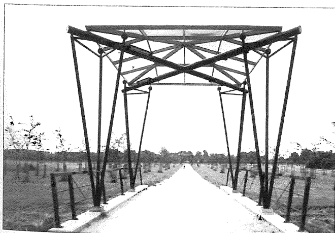
Bruggen in het Abtwoudsepark in Delft.

De organisator, het Nederlands Architectuurstudiecentrum, hoopte dat de tentoonstelling de discussie over parkontwerpen een stimulans zou geven. Informatie over stadsparken bij het Nederlands Architectuurinstituut, Westersingel 10, Rotterdam, tel. 010-4361155.