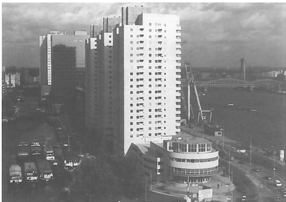
Woonstorens in de Leuvehaven.