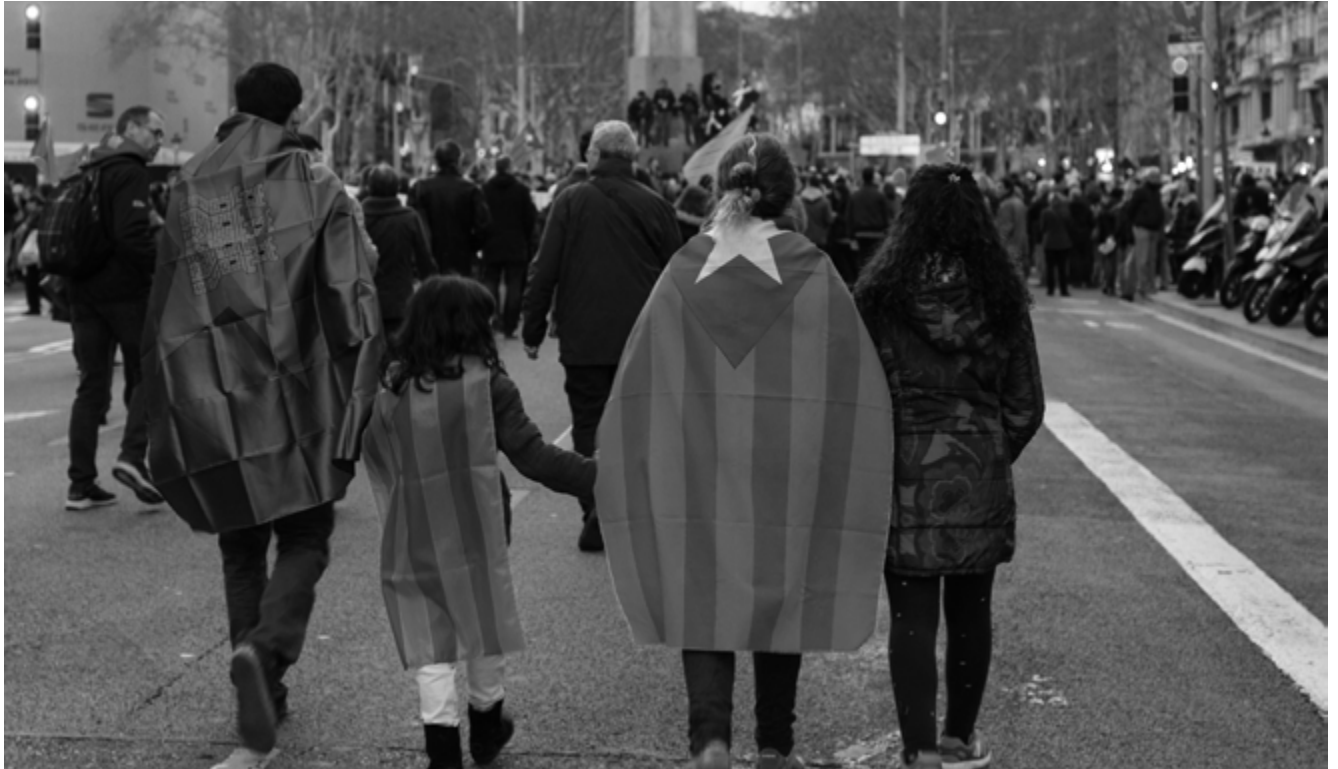
Demonstratie in Barcelona voor de Catalaanse onafhankelijkheid.

van kiesdistricten. Er bestaan zelfs verschillende methoden voor, die het midden houden tussen cynisme en creativiteit. Zo worden kiesdistricten soms samengevoegd wanneer in elk district 1 kandidaat (van de tegenpartij) sterk staat, waarbij na het samensmelten slechts 1 kandidaat meer overblijft. Maar evengoed worden soms kiesdistricten samengevoegd waarbij het ene uit een meerderheid van laagopgeleiden bestaat en het andere uit een meerderheid van hoogopgeleiden. Het resultaat is een kiesdistrict dat op het eerste zicht 'mooi in evenwicht' lijkt, maar waarbij de opkomst van hoogopgeleiden bij verkiezingen altijd hoger ligt en zo alsnog deze groep de overwinning zal behalen. Hoewel in België of Nederland de kiesdistricten minder makkelijk gewijzigd worden, en zeker niet telkens de volkstellingen volgt, speelt de discussie voor deze of gene afbakening evengoed mee in politieke overwegingen. In België is er het beruchte voorbeeld van het kiesdistrict Brussel-Halle-Vilvoorde, dat sinds de invoering van de taalgrens in 1963 twee taalgebieden (het tweetalige Brussel en het Nederlandstalige Halle-Vilvoorde) omvatte. Het dossier heeft tot 2012, wanneer de kieskring uiteindelijk gesplitst werd, menig verhitte communautaire discussies en zelfs een val van de regering (Leterme II) veroorzaakt.