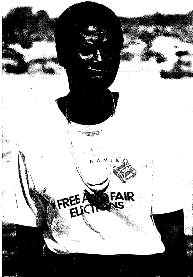
De UNTAG (United Nations Transitional Assistance Group) organiseerde in 1989 de machtsoverdracht en bereidde het land voor op vrije en eerlijke verkiezingen