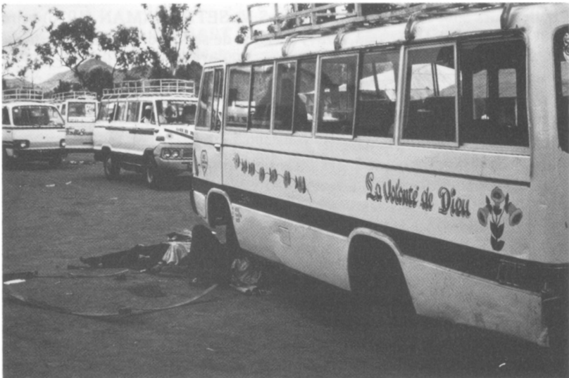
Transport public "informel" au Cameroun