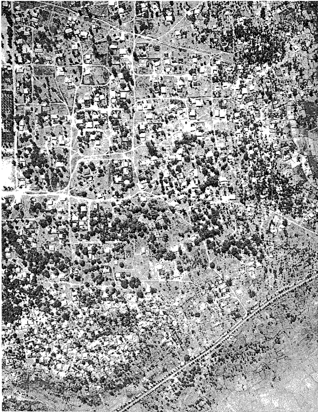
De georganiseerde wanorde van de wijk Lyndiane in Ziguinchor